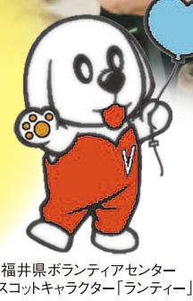
福井県ボランティアセンター マスコットキャラクター「ランティ」

福井県社会福祉協議会では、毎年9月に「ボランティア月間」と位置づけ、ボランティア活動の楽しさややりがいを発信しています。今年度は特にマスコットキャラクター「ランティ」を介した広報啓発や、若い世代への情報発信に力を入れています。