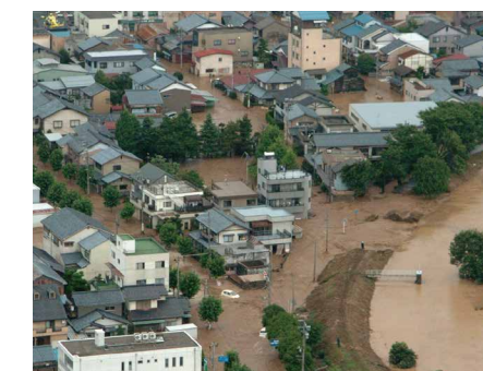
平成16年7月17日~18日にかけて発生した福井豪雨。足羽川の堤防が決壊し、死者4人、全壊住宅69棟、土砂災害138件という大きな被害をもたらしました

特にシニア世代の方にとっては道路が冠水し、歩みにくくなると。100年前と比べると大雨の回数が増えているというデータがあります。地球温暖化の影響もあって、方々で災害が起こった時にどう行動するか、正しい知識を持って備えておくことが大切です。