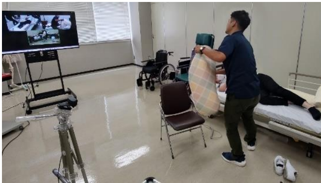
多数のカメラを配置してのオンライン研修

オンライン研修と対面・集合研修のメリットを活用し、今後も引き続き、福祉を支える担い手づくりに取り組んでいきます。