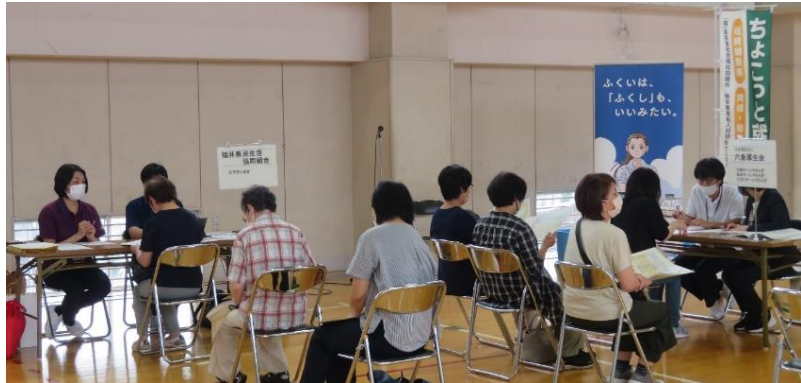
就職面談会の様子

今後「ちょこっと就労」就職面談会での積極的なマッチングを行うほか、助成制度の活用を呼び掛けるなど、事業所の積極的な採用活動の支援を行い人材不足解消へ、幅広い人材のマッチング支援を行ってまいります。