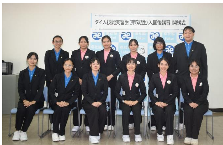
第5期生 入国後講習 開講式

今後も本会では、毎年春と秋の2回、定期的な受入れ支援を行い、県内の介護人材確保に取り組んでいきます。