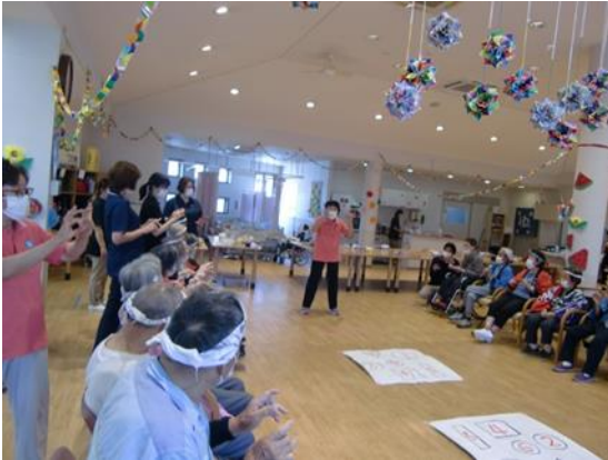
高齢者サロン（まごころ基金助成）

県内篤志家からの寄付金を運用し、県内の民間福祉団体等が実施する様々な社会福祉活動等に対して助成し、もって県内の地域福祉を推進するもので、平成3年以來、のべ995団体に対して合計1億7千万円を超える助成を行ってまいりました。