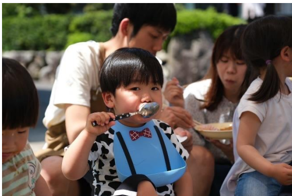
子ども食堂 (子ども未来支援事業による助成)

今年度は、5団体に各200,000円の合計1,000,000円の助成が決定しました。