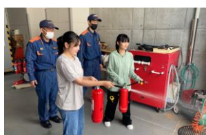
タイ人技能実習生受入れ実績（予定）