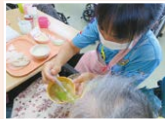
実習生による食事介助の様子

「明るい性格で、年配者に対する尊敬や思いやりに溢れる」タイ人介護技能実習生の受入施設を募集いたします。受入れについての相談等は下記までご連絡ください。