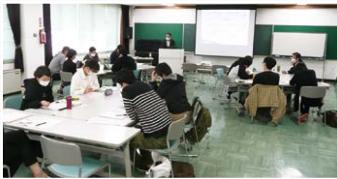
演習（グループ討議）の様子