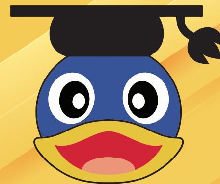
オリジナルキャラクター「ペンタ」