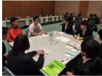
就職内定者キックオフセミナーの様子

〔研修事業数〕 32 事業 〔研修日数〕 282 日 〔総受講者数〕 延べ2,859 人 〔実施状況〕 ※別表のとおり